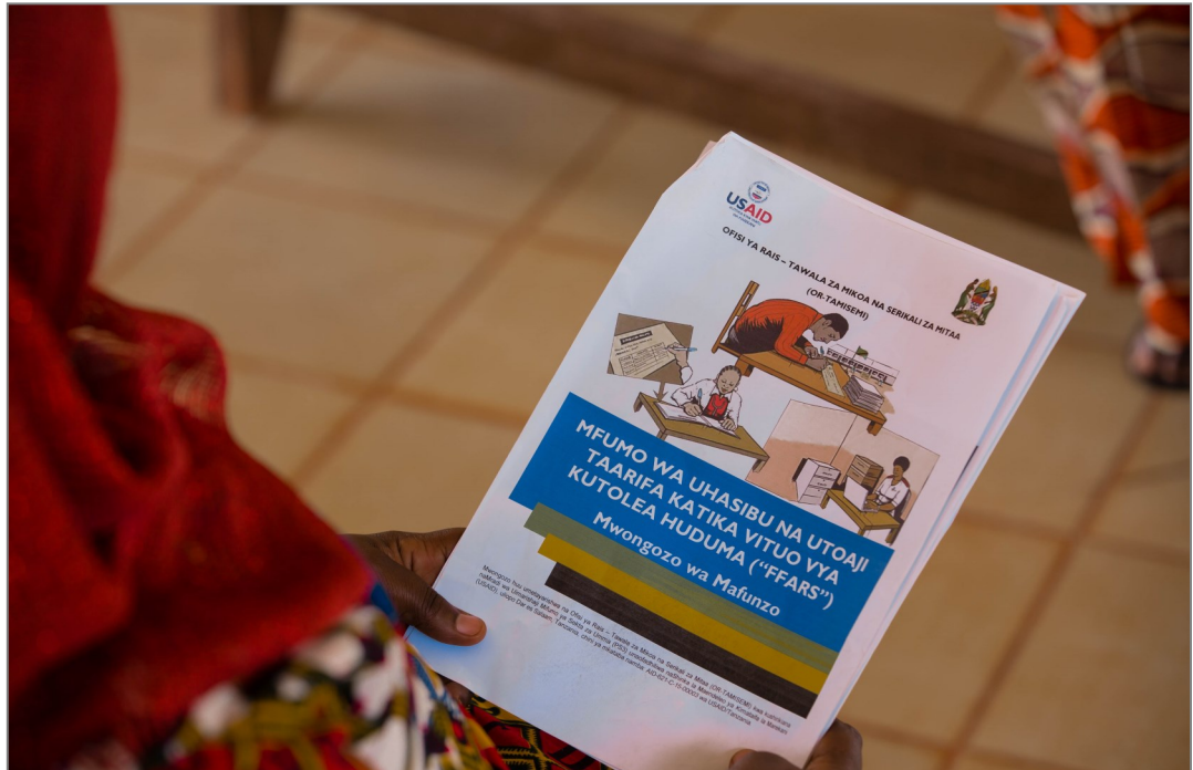
Nakala ya mwongozo wa mafunzo ya Mfumo wa Uhasibu na Utoaji Taarifa katika Vituo vya Kutolea Huduma.