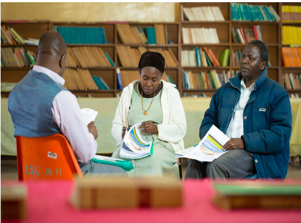
Baadhi ya watumishi wa Shule ya Sekondari ya Loleza jijini Mbeya, wakipata mafunzo ya FFARS kutoka kwa Mratibu wa Elimu Kata jijini humo.

kishwaji wa Raia, Rasilimali Watu, Rasilimali Fedha, Mifumo ya TEHAMA, pamoja na Tafiti Tendaji.