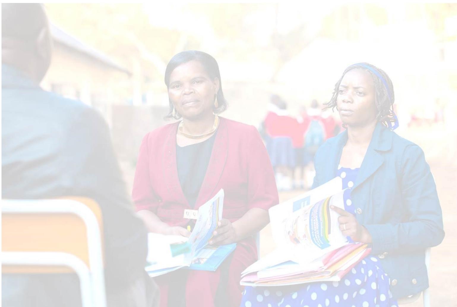
Picha ya mbele: Watumishi wanaohusika na kutoa taarifa za mahesabu katika shule yao iliyopo kwenye Halmashauri ya Jiji la Mbeya, wakifuatilia mafunzo ya Mfumo wa Uhasibu na Utoaji Taarifa za fedha kwa Vituo vya Kutolea Huduma (FFARS), kutoka kwa Mratibu wa Elimu jijini humo.