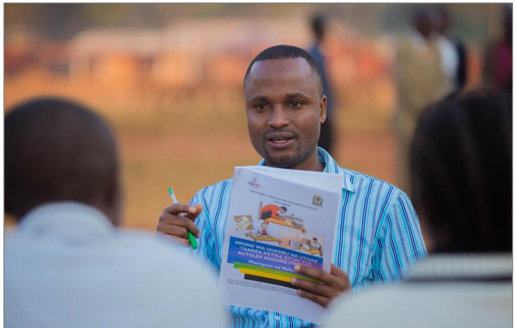
Mratibu wa Elimu Kata kutoka Wilaya ya Buhigwe mkoani Kigoma akitoa mafunzo kwa watumishi wanaojihusisha na masuala ya fedha katika Shule ya Msingi Buhigwe.