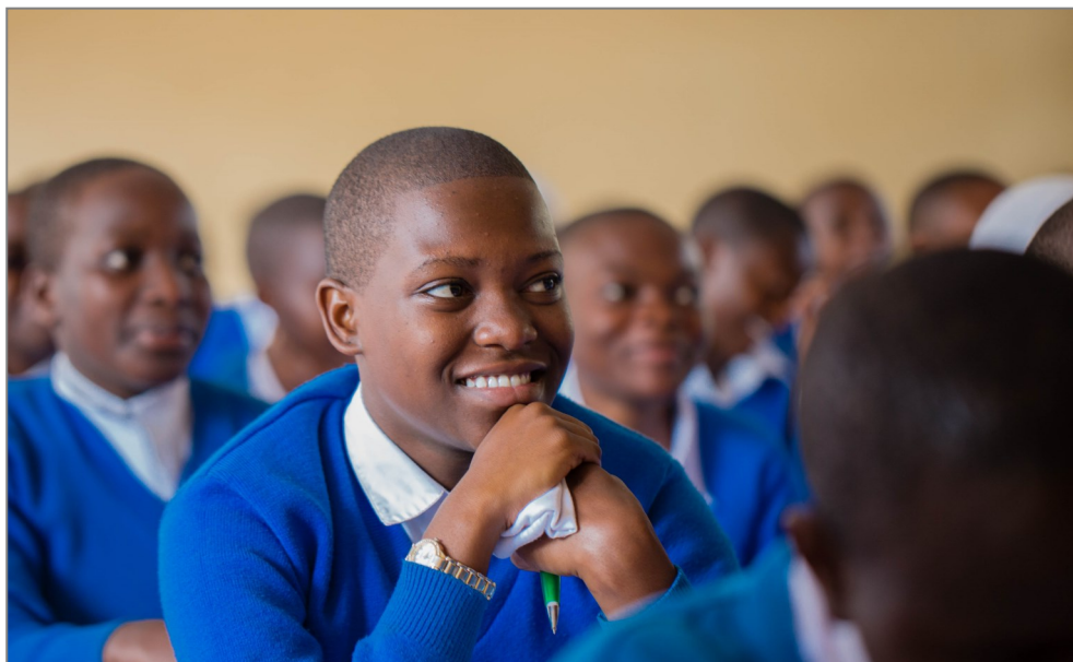
Wanafunzi katika Shule ya Sekondari ya Lolezi jijini Mbeya wakifurahia uwepo wa mafunzo ya uhasibu kwa watumishi wa shule yao, wakiaini yataimarisha usimamizi wa fedha za ruzuku zinazotoka Serikalini.