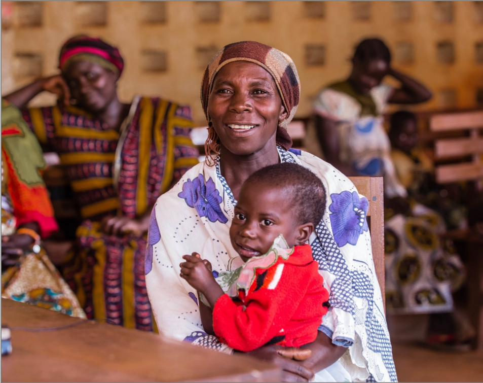
Mwananchi kutoka Halmashauri ya Wilaya ya Kasulu mkoani Kigoma akiuruahia habari kwamba Serikali itaanza kutuma hela moja kwa moja kwenye vituo vya kutolea huduma.

M apungufu katika mfumo wa usimamizi wa fedha za umma na utoaji taarifa katika ngazi ya mtoa huduma, imepelekea Shirika la Maendeleo ya Kimataifa la Marekani (USAID) kupitia mraidi wa Uimarishaji wa Mifumo ya Sekta za Umma (PS3) kushirikiana na Ofisi ya Rais Tawala za Mikoa na Serikali za Mitaa (TAMISEMI), Wizara ya Fedha na Mipango; Wizara ya Elimu, Sayansi, Teknolojia na Ufundi; na Wizara ya Afya, Maendeleo ya Jamii, Jinsia, Wazee na Watoto kuja na mfumo mpya.