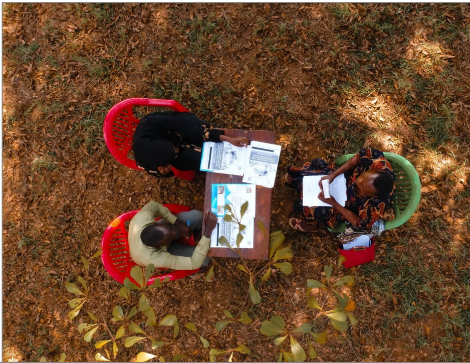
Mafunzo ya Mfumo wa Uhasibu na Utoaji Taarifa katika Vituo vya Kutolea Huduma (FFARS) yakiendelea katika eneo la shule Wilaya ya Kasulu, mkoani Kigoma.

Amesema awali kulikuwa na upotevu wa rasilimali fedha zilizokuwa zinatolewa kwenye vituo vya kutolea huduma, hali iliyosababisha Halmashauri kushindwa kutoa taarifa sahihi za matumizi ya ruzuku zilizokuwa zinatolewa kwenye vituo hivyo.