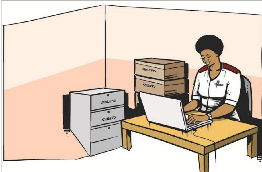
Mchoro ukionyesha mfano wa kuutumia mfumo wa FFARS kwa njia ya kielektroniki, katika kituo cha kutolea huduma. (Mchoro: Nathan Mpangala)

Luanda ameeleza kwamba kumekuwa na changamoto ya upatikanaji wa taarifa sahihi