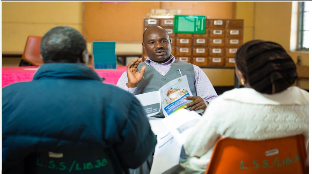
Baadhi ya watumishi wa Shule ya Sekondari ya Loleza jijini Mbeya, wakipata mafunzo ya FFARS kutoka kwa Mratibu wa Elimu Kata jijini humo.

Wengaa alitanabahisha kwamba mafunzo hayo yanafanyika katika mikoa 13 ya Tanzania bara inayotekeleza Mradi wa Uimarishaji wa Mifumo ya Sekta za Umma (PS3), ambapo waratibu elimu kata na waganga wafawidhi